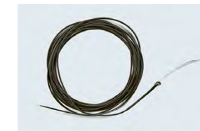
Sinktipp mit Tungstendust zur Beschwerung (Fliegenfischen)