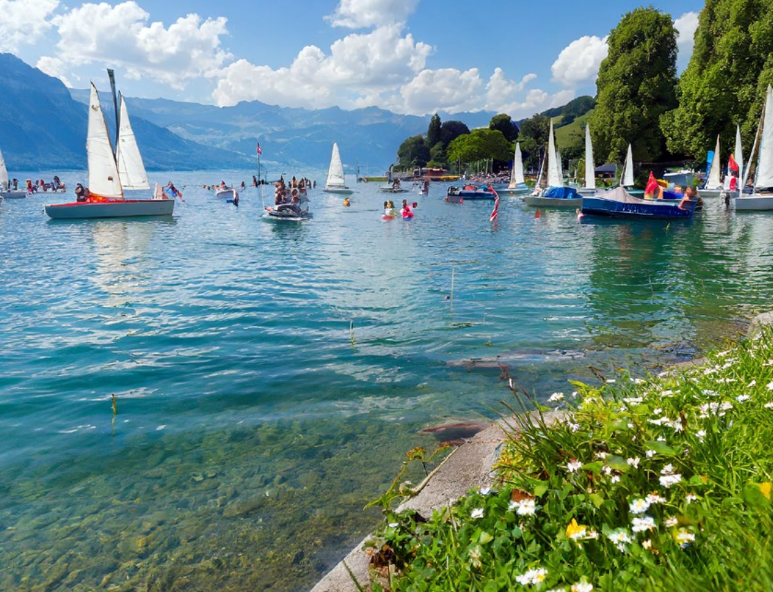
Bilder: AI-generated Photoshop 2024/Adobe Firefly